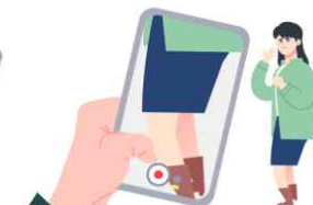
성폭력 범죄, 성희롱