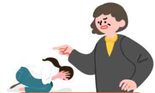
공무집행방해(업무방해), 부당한 간섭

※ 그 밖에 학교장이 「교육공무원법」 제43조제1항에 위반한다고 판단하는 행위도 교육활동 침해가 될 수 있습니다