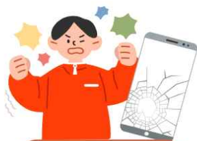
상해·폭행, 협박, 명예훼손, 손괴