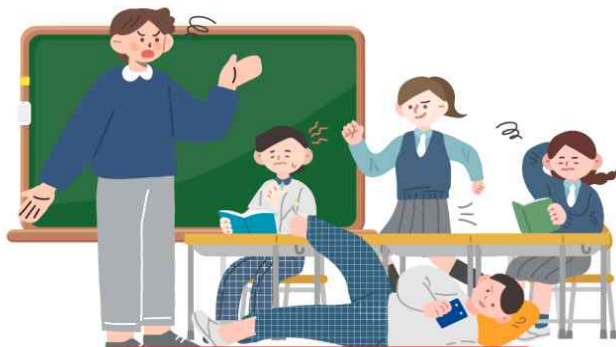
의도적인 수업 방해 행위 (신설)

교원의 정당한 생활지도에 불응하여 의도적으로 교육활동을 방해하는 행위는 교육활동 침해 행위입니다