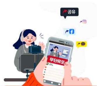
교육활동 중인 선생님의 영상·사진·음성 무단 유포